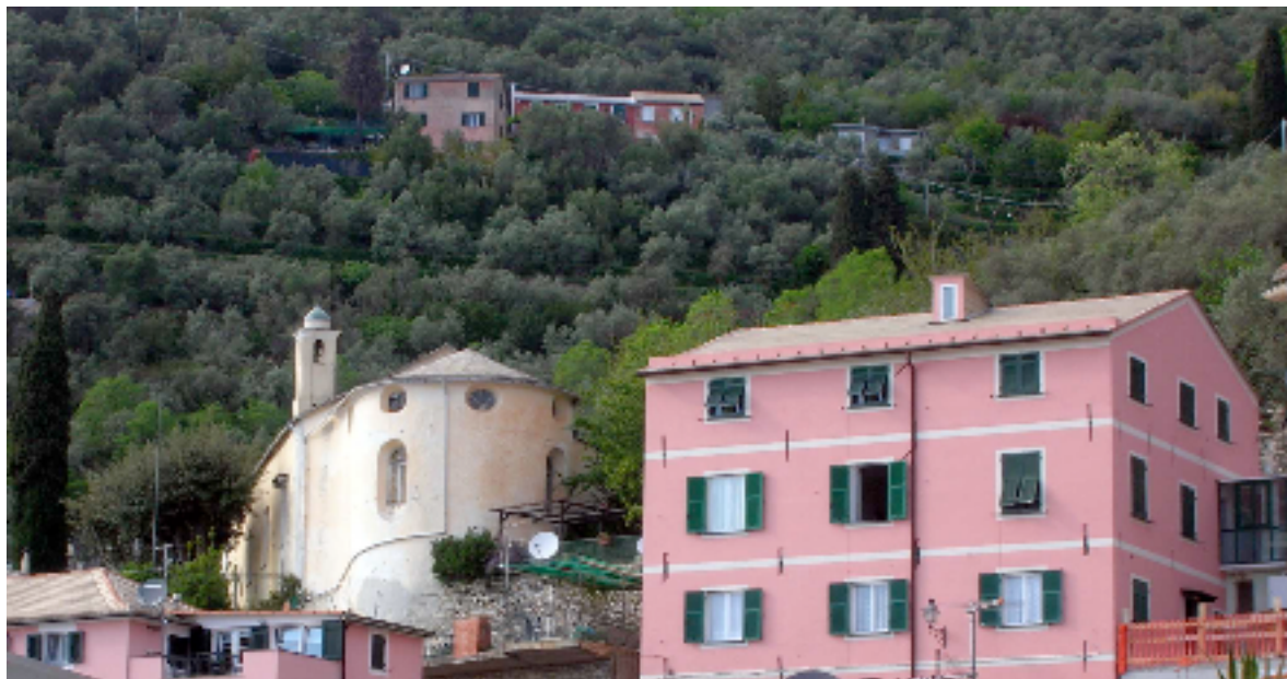
fig. 6 - l'Oratorio di sant'Antonio abate visto dalla piazza di Pieve alta