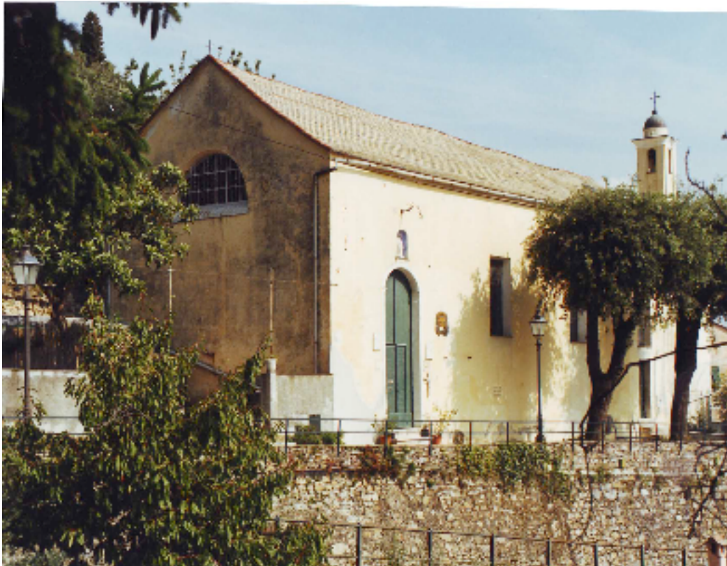
fig. 1 - la facciata dell'Oratorio di sant'Antonio abate