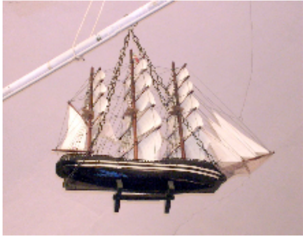
fig. 3 - ex-voto , modellino del Brigantino Nostra Signora delle Grazie

La dedica a Sant'Antonio era frequente nel mondo contadino, perché il santo è patrono degli animali, specie di quelli da stalla o da cortile.