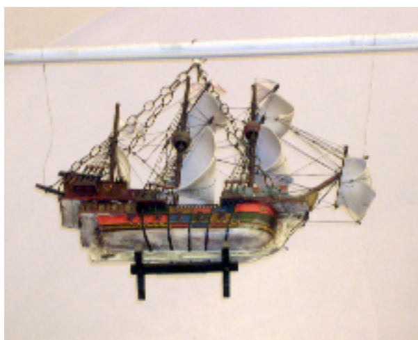
fig. 4 - ex-voto : modellino della Bombarda Concezione

(Notizie tratte dal libro Pieve su Pieve giù, leggende, ricordi, tradizioni, personaggi , a cura di Pie Luigi Gardella, 1999, pagg. 18-22 e dai Quaderni di Storia Locale, I volume , 2006, pp. 13-19).