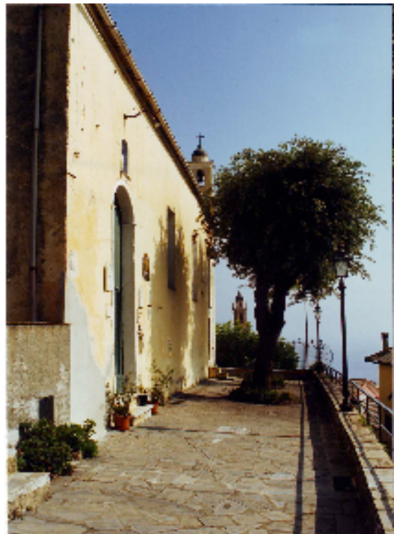
fig. 2 - l'Ingresso dell'Oratorio

Sappiamo poco della storia di questo Oratorio perché non vi sono documenti d'archivio, il documento più antico che si sia conservato risale al 1582 e descrive la visita del delegato del Papa, di monsignor Bossi, il quale visitò tutti gli Oratori della diocesi per accertare che la liturgia seguisse i dettami del Concilio di Trento.